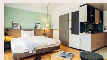
Studio mit Küche